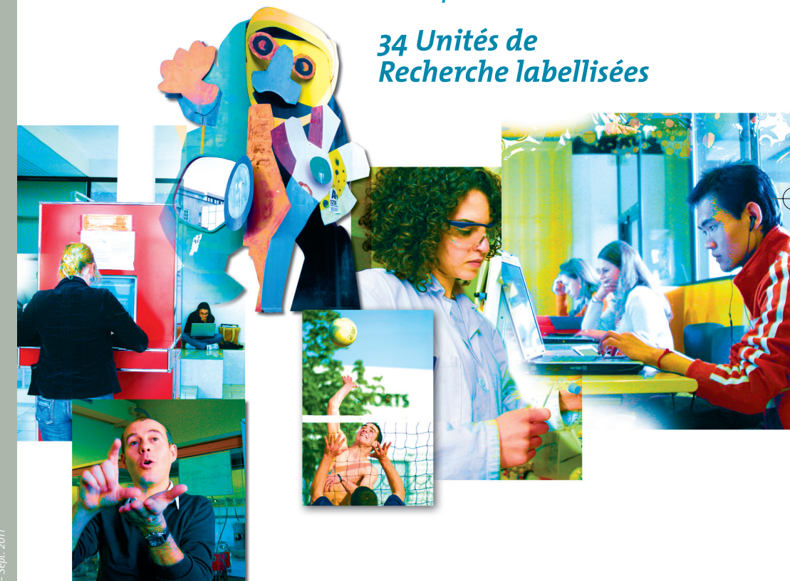
Conception : Service Communication uB – Sept. 2011