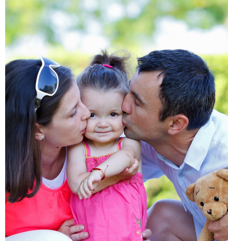
Conception : SEFCA - Juillet 2017