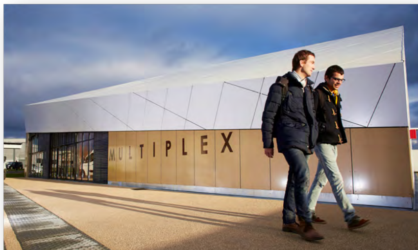
Université de Bourgogne