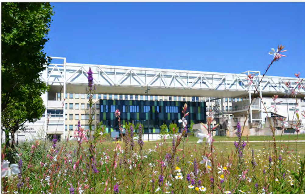
Université de Bourgogne

Université de Bourgogne, Dijon - 29 et 30 juin 2017